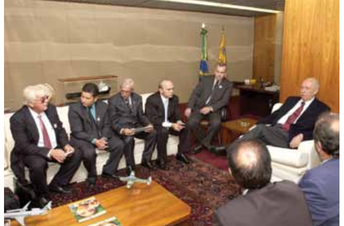
Encontro dos trabalhadores da Imbel e da Embraer com o vice-presidente José Alencar - 2006