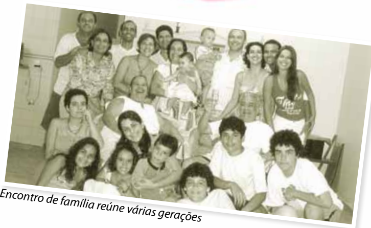
Encontro de família reúne várias gerações