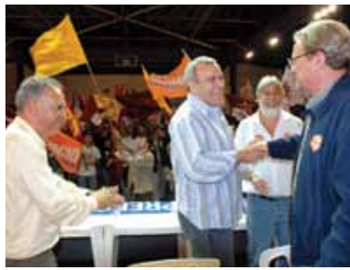
Campanha de Márcio Lacerda - 2006