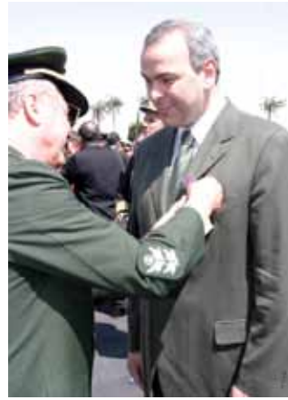
Homenagem do Exército Brasileiro - 2005