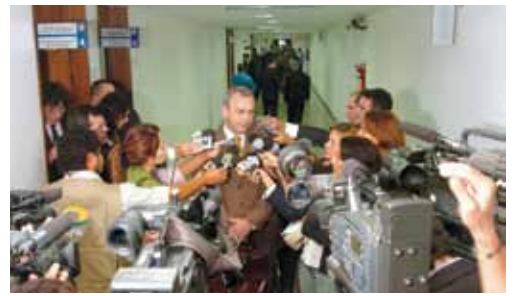
CPI dos Sanguessugas - 2006