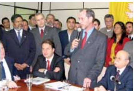
Filiação ao PSB com a presença do dep. Ciro Gomes e do governador Eduardo Campos - 2005