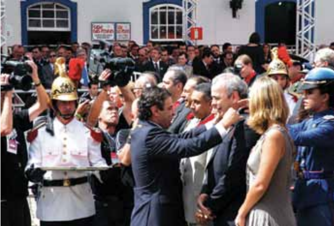
Recebendo a medalha da Inconfidência do governador Aécio Neves - 2008