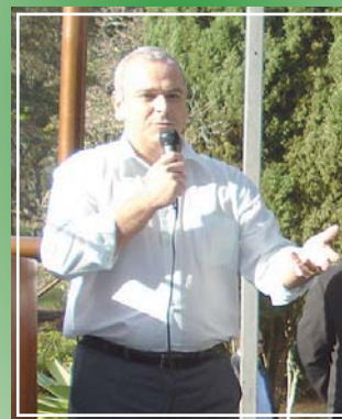
Deputado federal JÚLIO DELGADO ao discursar na solenidade de inauguração do Jardim Botânico.

“As pessoas de Juiz de Fora não vão ter mais que pular os muros para vir ver o que tem aqui dentro, agora vão poder entrar pela porta da frente. Esse é o maior presente que a gente dá para Juiz de Fora, para que toda a cidade possa usufruir”.