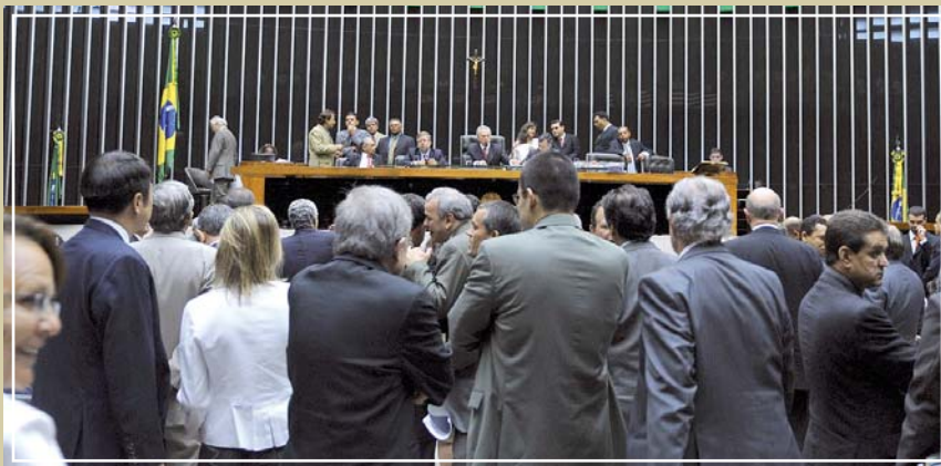
■ Votação da Medida Provisória 475 que garantiu 7,72% de reajuste para os aposentados

O deputado federal Júlio Delgado comemorou a aprovação e sanção do projeto que concedeu o reajuste de 7,72% para os aposentados e pensionistas que ganham acima de um salário-mínimo. Com o reajuste, o governo terá que fazer cortes no orçamento, o que na opinião do deputado não chega a ser um problema para quem perdoou a dívida