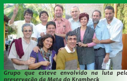
Grupo que esteve envolvido na luta pela preservação da Mata do Krambeck