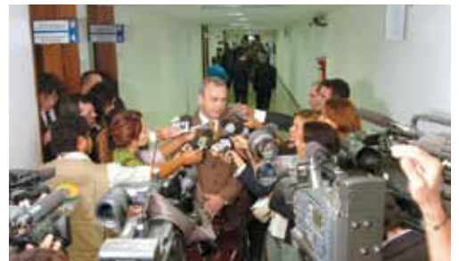
CPI dos Sanguessugas - 2006