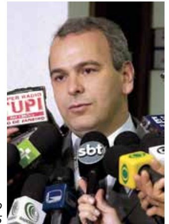
Entrevista no Conselho de Ética - 2005