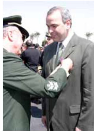
Homenagem do Exército Brasileiro - 2005