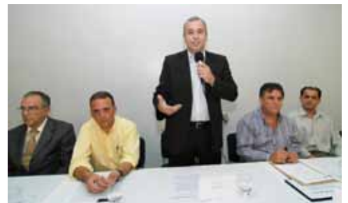
Debate na Associação Comercial sobre o fim da CPMF - 2008