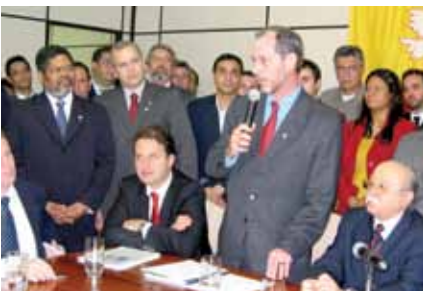
Filiação ao PSB com a presença do dep. Ciro Gomes e do governador Eduardo Campos - 2005