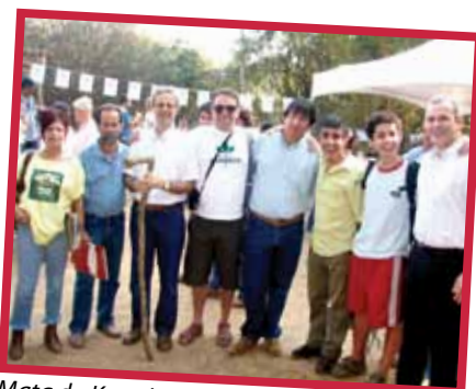
Mata do Krambeck - 2007

Projeto de sua autoria garante a aposentadoria por invalidez ao segurado que recebe auxílio-doença há mais de um ano, em decorrência das doenças relacionadas na Lei de Benefícios.