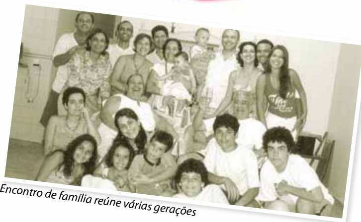
Encontro de família reúne várias gerações