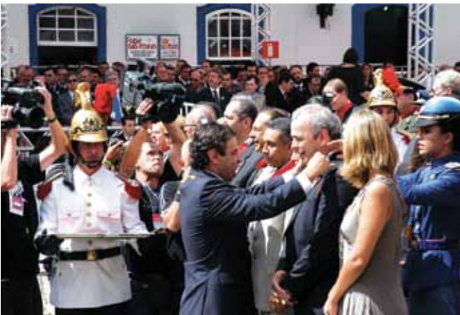
Recebendo a medalha da Inconfidência do governador Aécio Neves - 2008