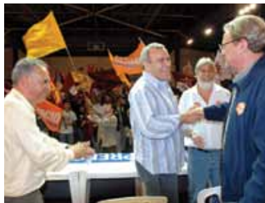
Campanha de Márcio Lacerda - 2006