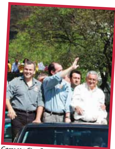
Carreata Ciro Gomes - 2002