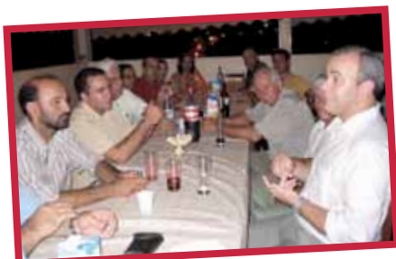
Além Paraíba - 2006

O deputado federal Júlio Delgado liderou a primeira missão comercial brasileira que visitou o Irã, Egito e Líbano em busca de novas oportunidades de negócio no Oriente Médio.