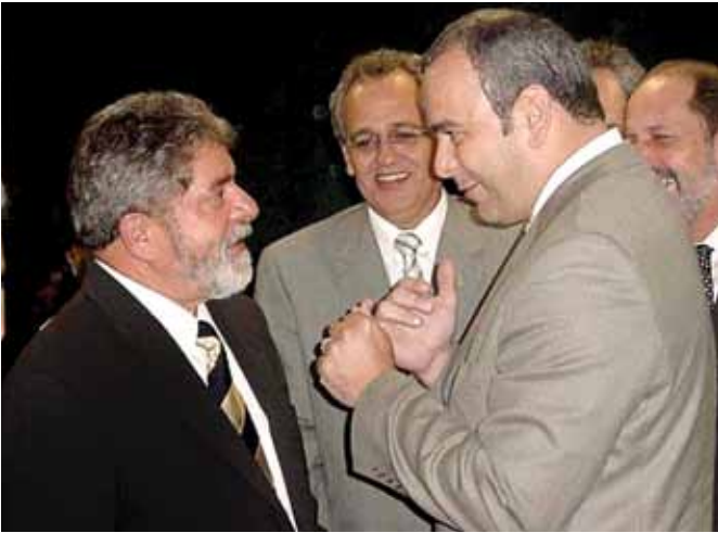
Audiência com o presidente Lula como líder de bancada - 2004