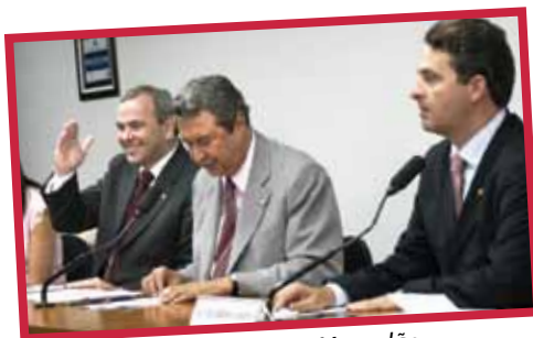
Entrega do relatório sobre o Mensalão no Conselho de Ética - 2005