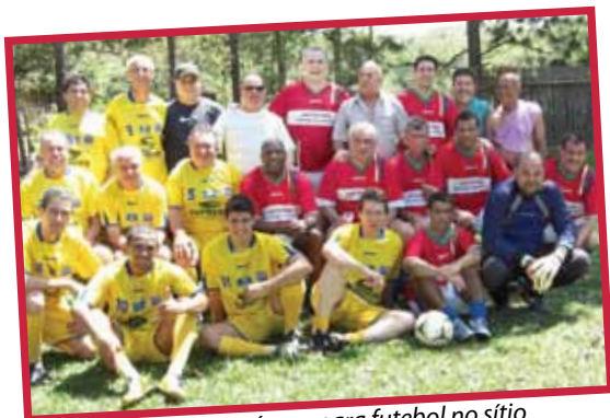
Júlio e os amigos se reúnem para futebol no sítio

O deputado solicitou ao Ministério dos Transportes a inclusão da BR-393 no Programa Emergencial das Estradas, do DNIT. O pedido foi aprovado e o Governo Federal destinou recursos para a recuperação total da rodovia, que liga Além Paraíba a Volta Grande, Estrela Dalva e Piraítinga.