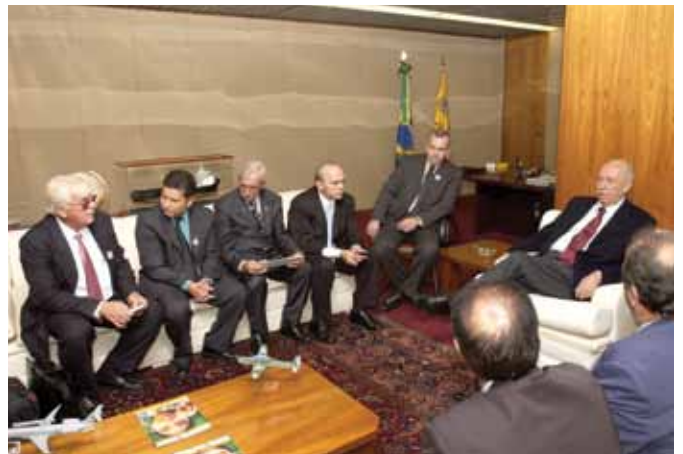
Encontro dos trabalhadores da Imbel e da Embraer com o vice-presidente José Alencar - 2006